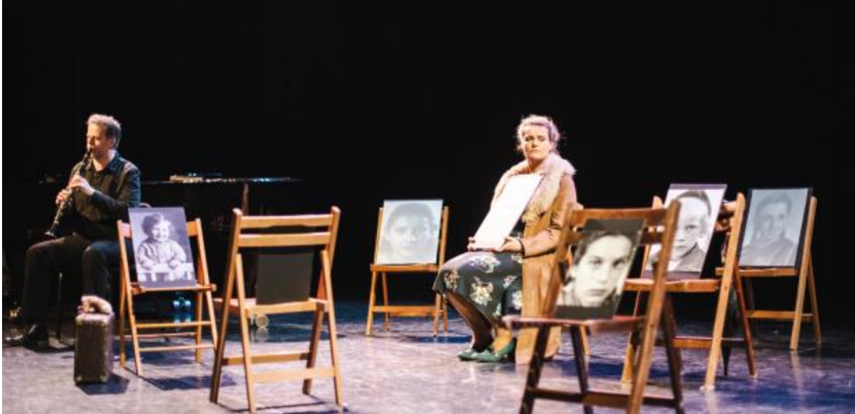
Truus Wijsmuller redde tienduizend joodse kinderen.